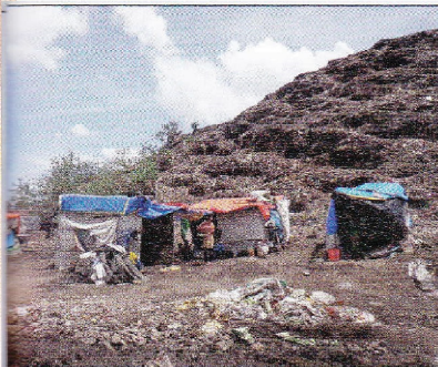
Planen als Schutz vor dem Monsun.

Aus dem Bericht 2016 geht hervor, dass Monat für Monat Lebensmittelpakete für 125 unterernährte Kleinkinder und deren Mütter übergeben werden