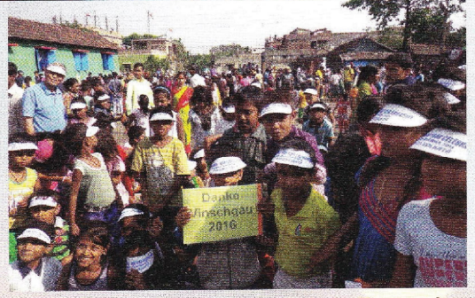
Ein Dankeschön aus Kalkutta an den Vinschgau.