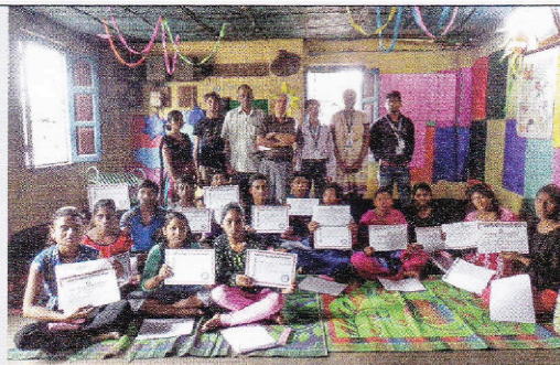
Schülerinnen und Schüler freuen sich über den Abschluss eines Computer-Grundkurses.