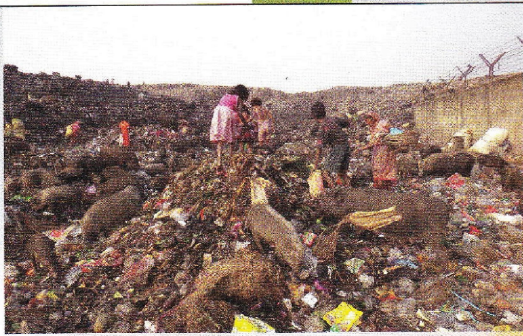
Überleben auf den Müllhalden in Bagar.